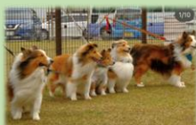
広いから並ぶのも楽々！