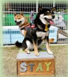
楽しい遊具もあり！

今後のイベント情報は SNS からの発信に切り替わります。 この機会に皆様の新規登録宜しくお願ひします。