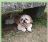
時には休むのも大事！